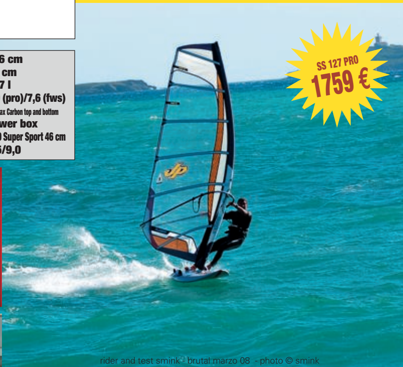
rider and test smink - brutal marzo 08 - photo © smink

il modello FULL WOOD SANDWICH costa 1499 euro