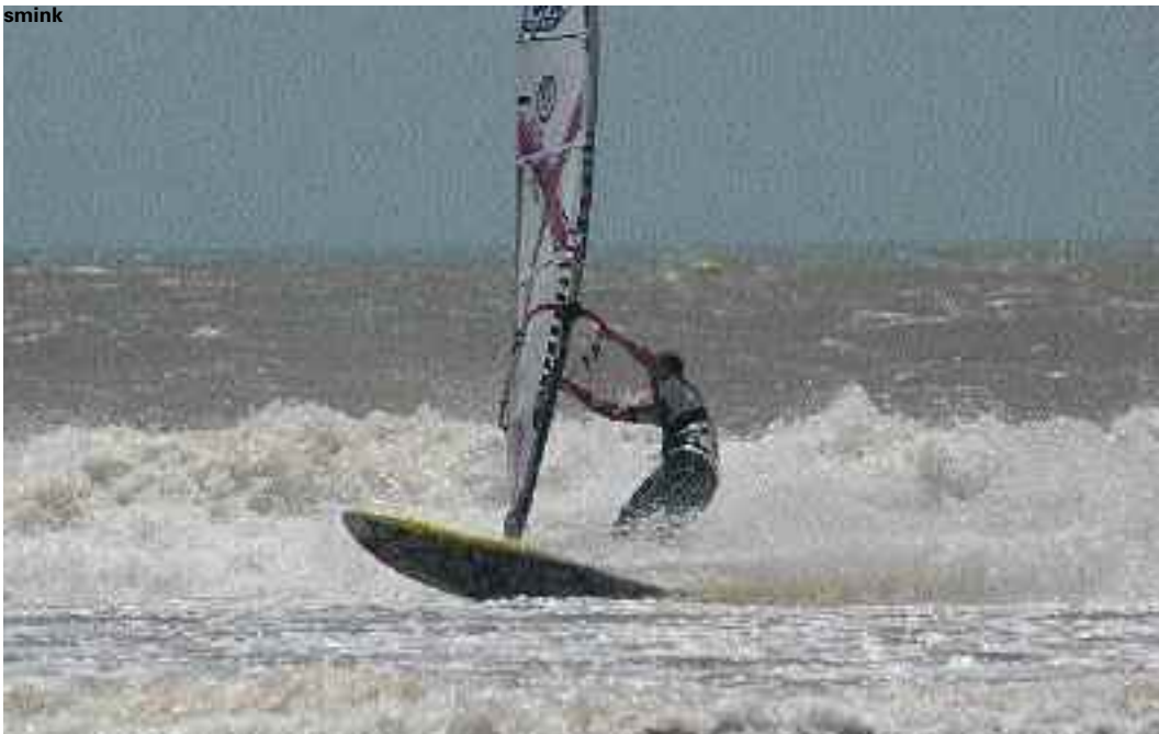
A Sidi, spesso, il vento, quando è particolarmente forte, schiaccia ed incasina le onde... ma il divertimento non manca lo stesso!