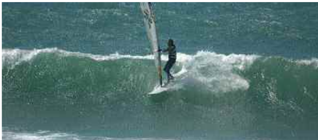
Onda bella, ma si può surfare decentemente con la 5.8 ed il freewave 95?!... Chi si accontenta gode, dice smink!