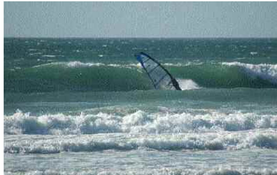
Fine agosto.. dopo tanto penare anche il Guincho regala una giornata decente e Diga non se la fa scappare, nonostante avesse già fatto i bagagli...