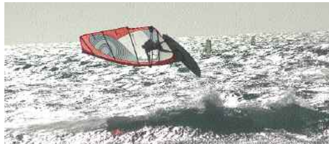
Finalmente il vento aumenta anche al Guincho e nello spot si comincia a vedere, come ai bei tempi, una "marea" di wavers...